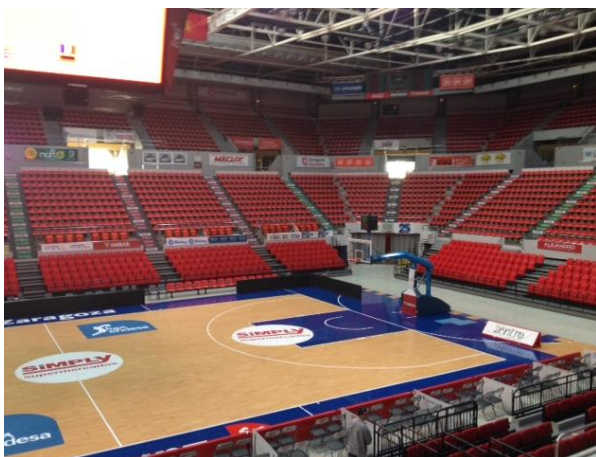
Foto “Interiér haly” - nízké tribuny zmizí. Zavěšená kostka (levý horní roh na fotce) bude ukazovat výsledek aktuálního týmu a průběžné pořadí. Live streaming na tabuli byl zavrhnut kvůli časovému zpoždění signálu.

Foto “Maketa haly” - pohled je zezadu, odkud budou vstupovat závodníci. Vstup pro ostatní je z druhé strany. Zvláštní vstup je pro akreditované osoby.